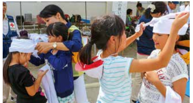
※掲載画像は昨年の防災訓練のものです。