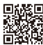
▲特産品化ホームページのQRコード