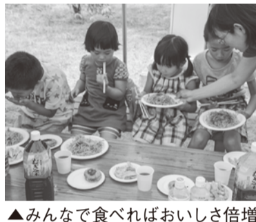
▲みんなで食べればおいしさ倍増

「おいしい」「楽しい」と全国的にも好評の「子ども食堂」は、市内では初めての取り組み。同会は大網ロータリークラブの協力を受け、子どもたちに素敵な居場所を提供しました。