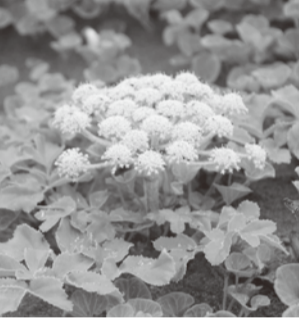
▲みんなで食べればおいしさ倍増

※当団体は白里海岸での環境の整備と、自生する海浜植物ハマボウフウの保護・再生活動も行っています。 問街資源再興プロジェクト事務局(まちサポ) 0475(72)8278