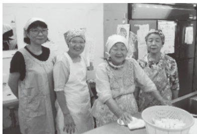
▲夏休みに開催した子ども食堂のボランティアの皆さん