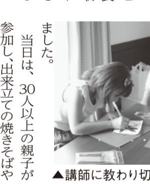
▲講師に教わり切り絵に夢中

当日は、30人以上の親子が参加し、出来立ての焼きそばやポテトフライ、かき氷に舌鼓。また、切り絵教室も開かれた。子供たちは、花や動物を型どった切り絵に挑戦。講師の説明に耳を傾け、懸命に手と頭を使いました。