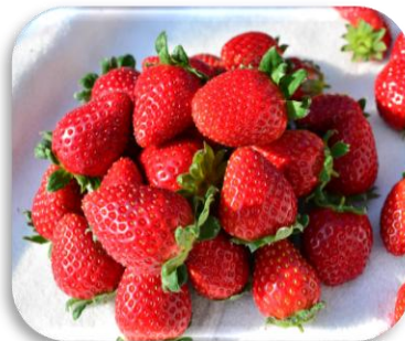
真紅の美鈴 (いちご)