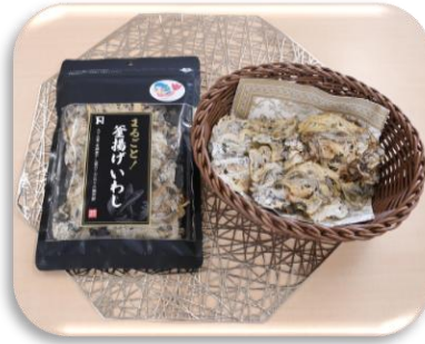
釜揚げいわしせんべい