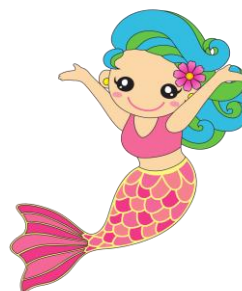
大網白里市のキャラクター「マリ」