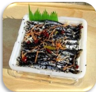
いわしのゴマ漬け

【海産物】 煮干し(生産量は全国トップクラス)・みりん干しかたくちいわし・ししゃも など