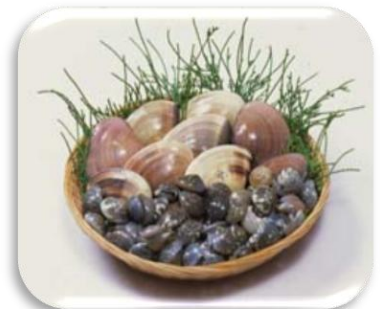
はまぐり・ながらみ