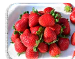
真紅の美鈴(いちご)