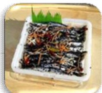
いわしのゴマ漬け