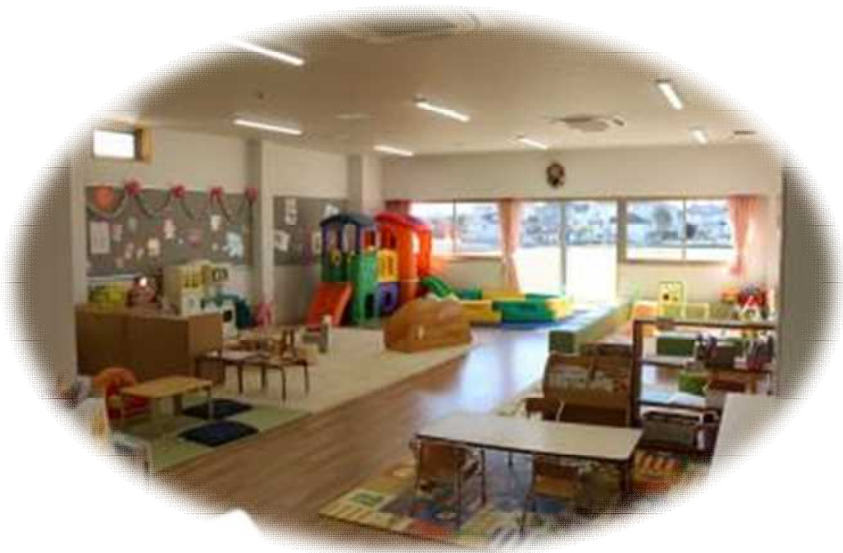
子育て支援センター（マリニルーム）

※2：児童発達支援事業・・・発達の気になる就学前のお子さんに日常生活の基本動作や、集団生活の適応訓練等の療育を行い、また、保護者との相談や指導等の支援を行っています。 （きりん幼児教室）