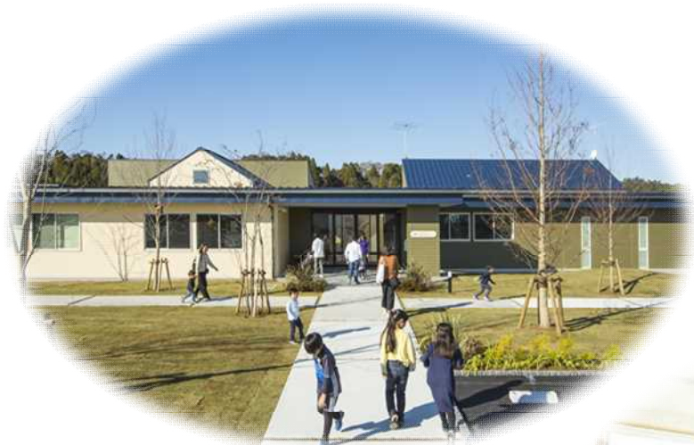
子育て交流センター

みどりが丘地区に整備した子育て交流センターは、子どもが自由に遊び、学べる施設としての児童館や学童保育、子育て支援センターを併設した総合的な子育て支援施設として、子どもの居場所づくりをサポートします。