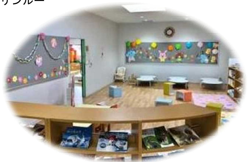
ホール（図書コーナー）