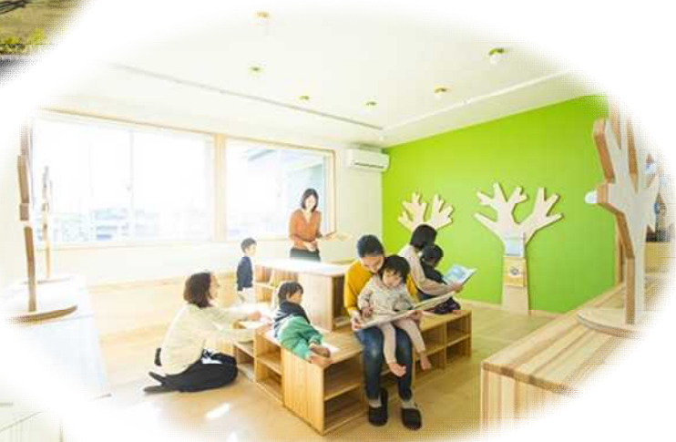
子育て支援エリア