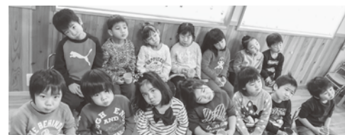
▲右側の歯に届くようにブクブクブク

ムシ歯を予防するためには、生えだての時期が最も重要です。市では歯と口の健康に寄与できるように、永久歯のムシ歯予防として今後も本事業の実施拡大を目指します。