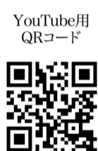
▲式典の様子をご覧ください。