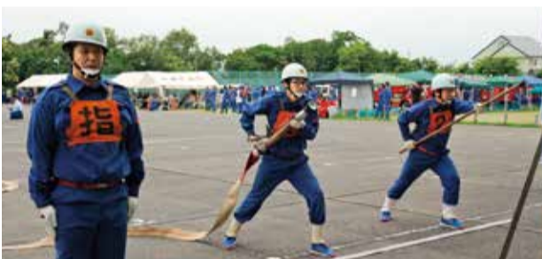
▲小型ポンプ操法の演技(昨年の大会から)

エンジを活用すれば、首都圏へのお出かけも一段と快適になります。大型連休中のこの機会を利用して充実した観光を楽しんでみませんか。