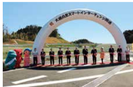
▲関係者によるテープカット