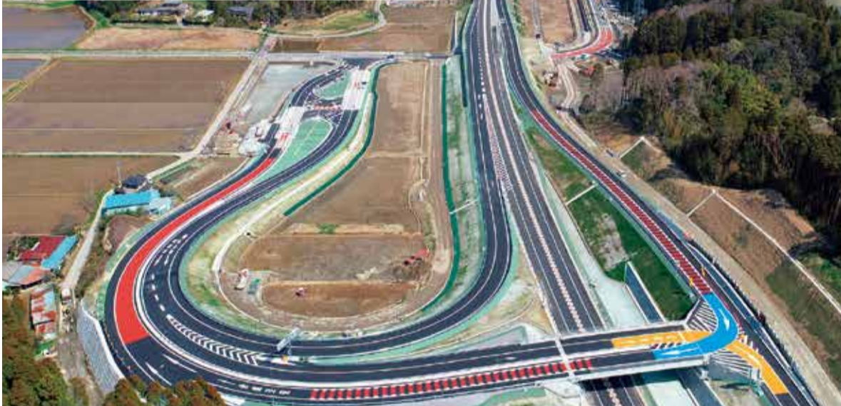
▲スマートインターチェンジを臨む

首都圏中央連絡自動車道(圏央道)の「大網白里スマートインターチェンジ」が3月24日、市内小中地区に開通しました。平成25年からスタートした事業が結実し、交通利便性が格段に向上。内にも外にも大網白里市が一層、身近になりました。