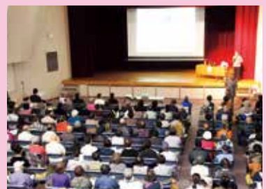
▲健康作り講演会の様子