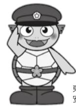
東金警察署管内 安全安心キャラクター「とうがめくん」