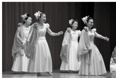
▲華やかなステージの部