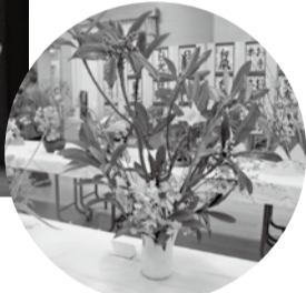
▲力作ぞろいの展示の部