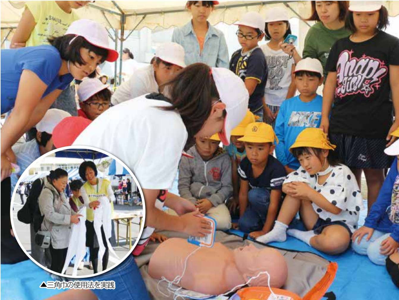
▲三角巾の使用法を実践