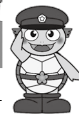
東金警察署管内安全安心キャラクター「とうがめくん」