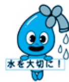
山武郡市広域水道企業団 マスコットキャラクター 「さんすいちゃん」