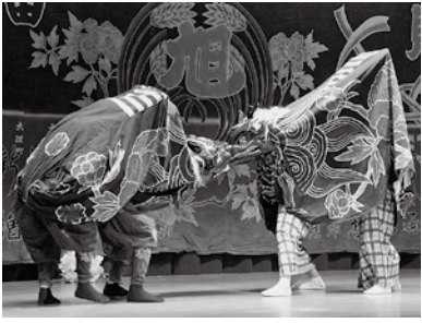
▲永田旭連の獅子舞

市内の文化財から「宮谷県庁跡」、「永田旭連の獅子舞」が、本市を含む地域から「九十九里地域の大漁節」、「九十九里浜の景観」が、ちば文化資産に選定されています。奮って応募ください。