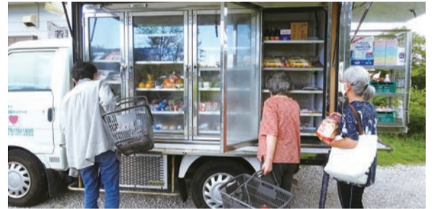
▲移動販売車でお目当ての買い物をする利用者の皆さん

買い物で困っている高齢者へ生鮮食品等を届けるため、NPO法人地域支援ネットワークの運営するトラックが市内を巡回しています。