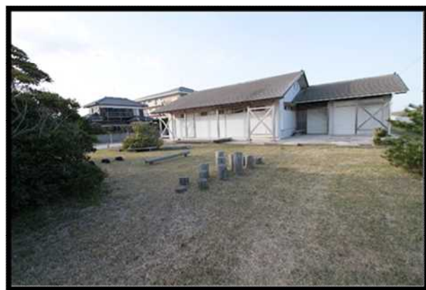
四天木彫刻の広場