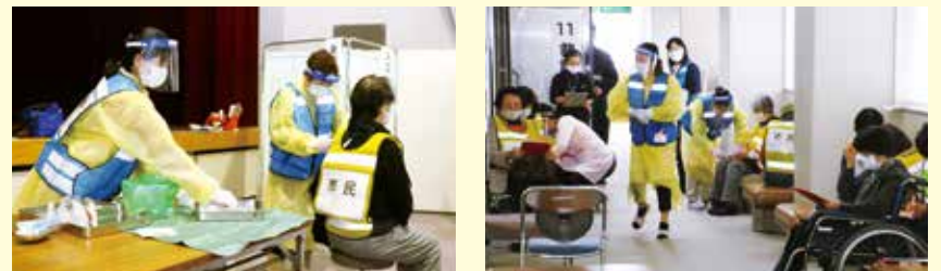
▲新型コロナワクチン集団接種に向け、シミュレーションを行いました