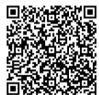
▲デジタル美術展のページ

新型コロナウイルスの影響で中止となっていた、市美術会主催の第25回ふるさと美術展の作品を、デジタル博物館の中で「デジタル美術展」として公開しました。市美術会会員の皆さんの作品をパソコンやスマートフォンでご鑑賞ください。