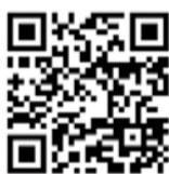
▲大網白里市メール配信サービス

災害時に、市から事前登録したメールアドレスに防災情報を配信します。登録が必要です。 「oamishirasa@entry.mail-dp.jp」に空メールを送信し、返信されたメールの内容に沿って登録してください。QRコードを読み取ると