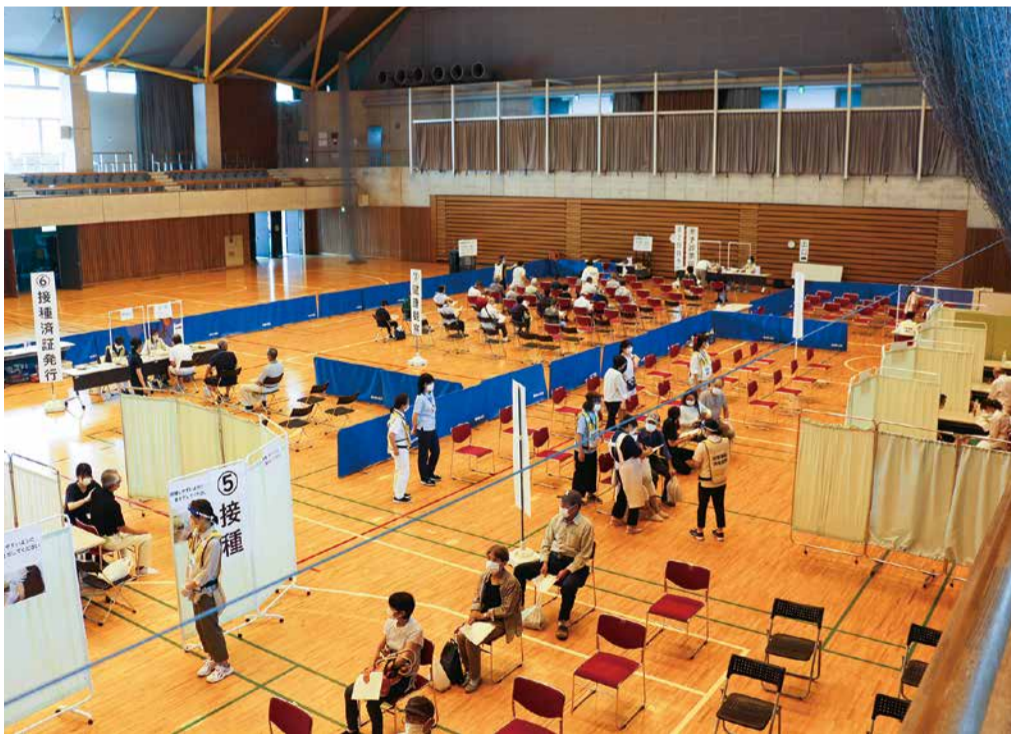
新型コロナウイルスワクチン接種会場の様子

令和3年第2回定例会は、6月3日から6月24日までの22日間の会期で開催されました。 この定例会では、市長から提出された議案10件と、人権擁護委員に係る諮問1件に加えて、請願3件の審査を行いました。議案については、すべて原案のとおり可決・同意・承認とし、諮問1件については適任と認め、請願3件のうち2件を採択、1件を不採択としました。 また、議員発議による3件の提案があり、いずれも可決しました。一般質問は、2日間の日程で行われ、会派代表質問3会派・9人、個人質問5人の議員が登壇しました。