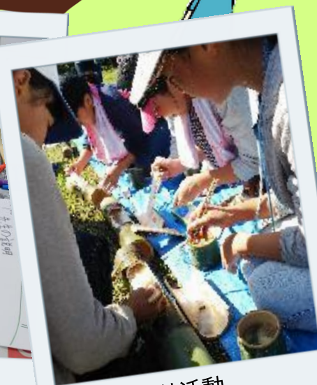
野外活動 (竹でご飯を炊こう)

▲講座は全4回のプログラムです。プログラムの詳細は裏面をご覧ください。 全4回の講座に日帰りで参加することができます。 新型コロナウイルス感染症の状況により、内容を変更とする場合があります。