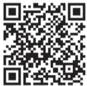
▲ウォーキングマップ