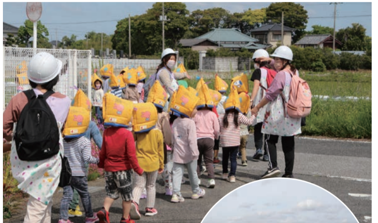
▲避難場所を目指し素早く移動

5月10日に白里保育所で津波想定避難訓練が実施され、園児たちや職員、保護者会の協力員、地元消防団等が参加しました。