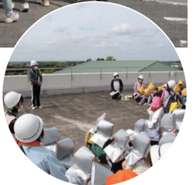
▲避難先の白里小学校屋上

訓練では、地震による津波の発生を想定し、地震が起こってから屋外への避難、保育所から避難場所の白里小学校への徒歩での移動などを行い、いざというときのための迅速な避難行動や避難経路を確認しました。