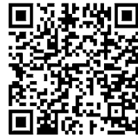
▲千葉県ホームページ

自転車利用者が加害者側となる事故で、高額な損害賠償を請求される事例が多く発生しています。事故を起こしてしまったときに備えて、自転車保険に加入しましょう。詳細は千葉県ホームページをご確認ください。 ※自転車の事故による相手のけが等を補償できる保険であれば、自転車専用の保険