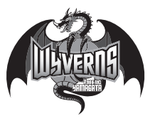
山形ワイヴァンズ

アルティリー千葉は、千葉県内2番目のプロバスケットボールチームとして2021年に誕生し、千葉市をホームタウンとする新しいチームです。