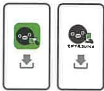
アプリをダウンロード