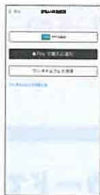
支払い方法は [ワンタイムクレカ決済]を選択

「ワンタイムクレカ決済」とは、モバイルSuica通学定期券をご購入いただく際及び、Apple PayのSuica新規発行の際に、モバイルSuica会員本人がクレジットカードをお持ちでなくても、保護者等のクレジットカードによる決済を可能とするサービスです。クレジットカード番号等の情報がアプリ内に残ることはありません。