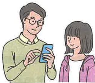
クレジットカード情報の入力