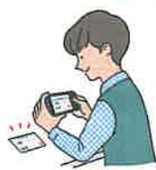
定期区間・経路等の入力後、 通学証明書等を アップロードして予約