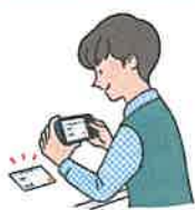
証明書等のアップロード