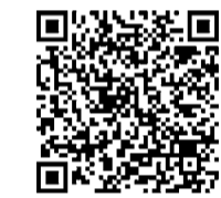
▲備蓄品チェックリスト