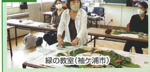
緑の教室(袖ヶ浦市)