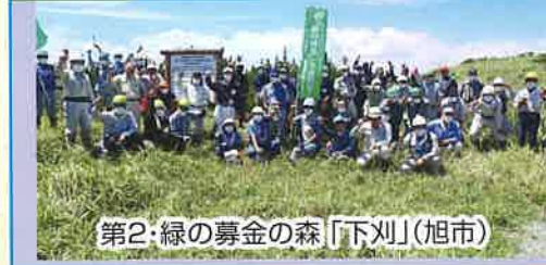
第2:緑の募金の森「下刈」(旭市)