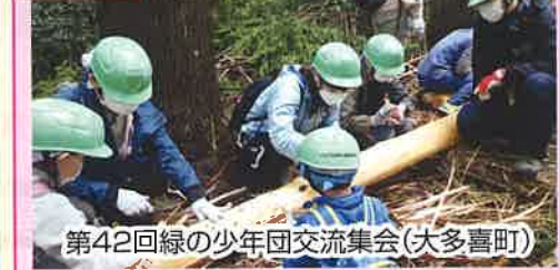
第42回緑の少年団交流集会(大多喜町)