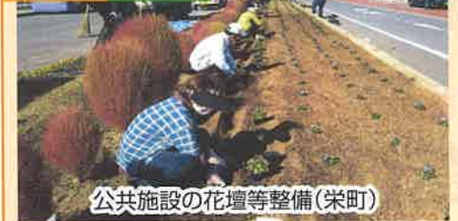
公共施設の花壇等整備(栄町)