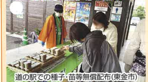
道の駅での種子・苗等無償配布(東金市)