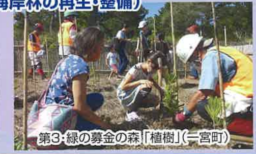
第3:緑の募金の森「植樹」(一宮町)