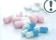
医薬品の多量摂取