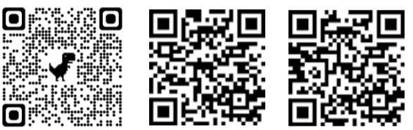
▲大網白里市おとなの健康づくりガイド QRコード ▲集団検診申込用 QRコード ▲個別がん・肝炎検診申し込み用 QRコード

(保) = 保健文化センター、(公) = 中央公民館 ◎全ての健診と10か月乳児相談は個別通知をしています。上記事業は予約制ですので、必ずご連絡ください。 ◎健康相談・子育て相談は随時行っていますので、お問い合わせください。