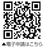
▲電子申請はこちら

◇おとなの歯科検診(歯周病検診)・プレママ歯科検診 5月31日(水)、9月1日(金)、12月1日(金)、3月2日(土) 13時~14時の間を予定 ▶会場=保健文化センター1階 ▶内容=歯科診察(むし歯・歯周病) 染め出し、ブラッシング指導、フッ素塗布(希望者) ▶対象=昭和28年、38年、48年、58年、平成5年、15年度生まれの方および妊婦の方 ▶持ち物=母子健康手帳(妊婦のみ)、健康手帳(持っている方)、健康ポイント手帳(12月の日程までは対象事業となります) ▶費用=無料