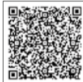
▲千葉県電子申請サービス

(引率者)での参加 ▶参加費=無料 ▶競技方法=チームごとにコマ図に従ってコースを歩きます。チェックポイントでの課題得点と時間得点の合計で順位を決定します。 ▶申込方法 ①千葉県電子申請サービスから申し込み ②参加申込書に必要事項を記入の上、生涯学習課へ提出 ▶申込締切=10月27日(金) 問 生涯学習課生涯学習班 0475(70)0380