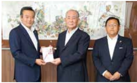
▲商工会長、商工会住宅相談会事業委員会委員長から目録の贈呈