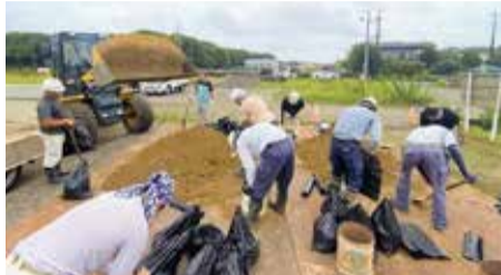
▲土のう作りの様子