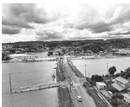
冠水被害の著しかった大竹地区

今回の定例会は、令和5年11月5日告示、同日12日執行予定の大網白里市議会議員一般選挙以後に日程案を予定しますので、決定次第、市ホームページ等でご案内いたします。