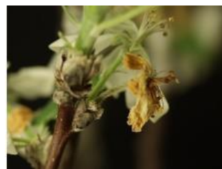
花や幼果での発病