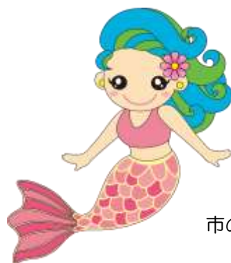
市のキャラクター マリン