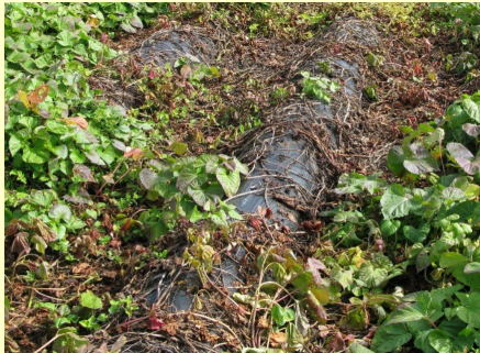
地上部の生育不良・枯死