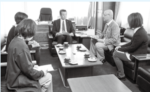
※「市こども家庭支援員」以下「支援員」

市長 行政の重要な役割を改めて認識しました。今後も、地域全体で子育てを支えるまちづくりを進めていきます。