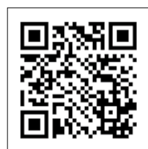
▲備蓄品チェックリスト(市ホームページ)