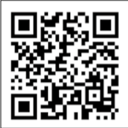
▲千葉ロッテマリーンズ特設サイト

▼申込期間 3月1日(金)12時～24日(日)22時 ▼抽選結果発表 4月上旬に球団よりメールにて通知 ※新型コロナウイルスの理由から企画を中止する場合があります。