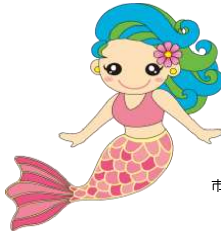
市のキャラクター マリン