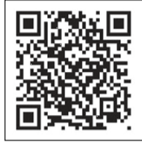
特設サイト(経済産業省資源エネルギー庁)

金融機関の窓口やコンビニエンスストア以外にも、地方税お支払サイト(クレジットカード払い)やスマートフォン決済アプリ等を利用することで24時間いつでも納付が可能です。