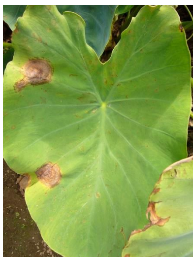
写真1 葉に発生した病斑

最初の伝染源は、本菌が感染した種いもやほ場周辺に放置された残さ、残さから発生した野生の株である。葉や葉柄の病斑上に形成された遊走子が、風雨や畝間に溜まった水等を介して、感染が始まると考えられている。