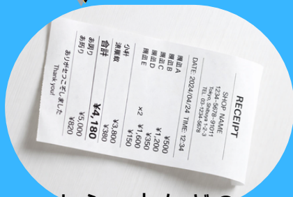
レシートなどの 感熱紙