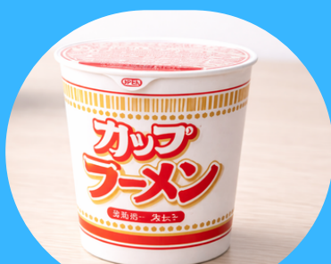
紙マークのついた カップ麺の容器