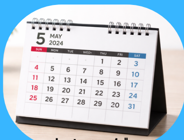
カレンダー 金具がついたままでOK 手間がかかりません！