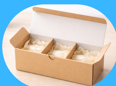
お菓子などの 紙箱