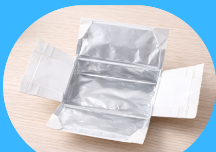
内側がアルミ加工 された紙パック