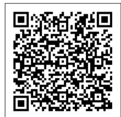
▲詳細 (日本年金機構HP)