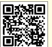
▲食生活改善会のおすすめレシピ