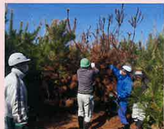
緑の募金の森(海岸林)の造成 (旭市)