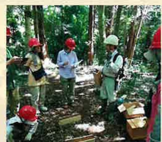
おとなの木育(千葉市)