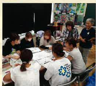
みどりの教室(袖ヶ浦市)