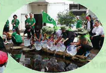
緑の少年団による学校や 地域の緑化活動(流山市)