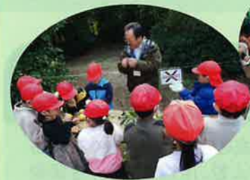
小学校の校外学習支援(袖ヶ浦市)