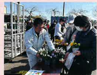
さんむ莓まつり(山武市)