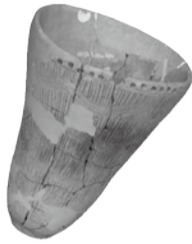
▲ 縄文土器の3Dのイメージ